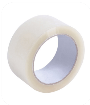
Fita Adesiva 40m