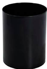
Cesto de Lixo 12l