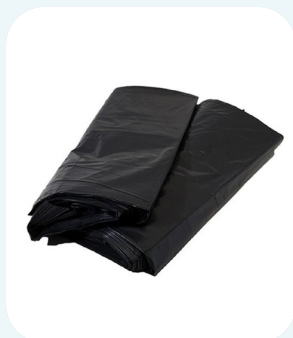
Saco de Lixo 100L