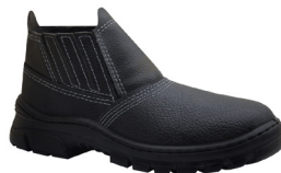
Bota com Bico PVC