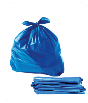
Saco Lixo 40lt