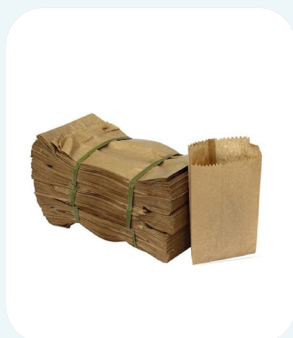
Saco Papel Kraft