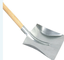
Pá de Lixo Zinco