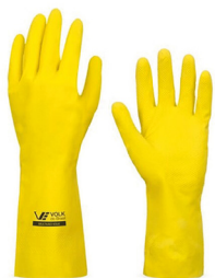
Luva de Borracha